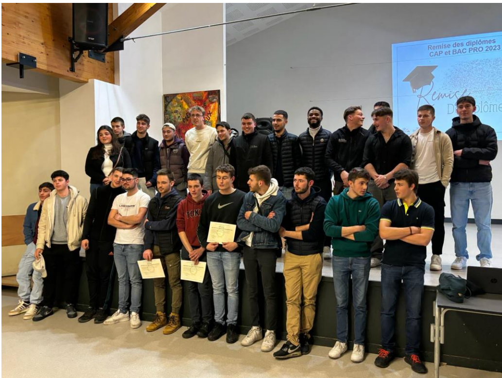
Elèves ayant obtenu leur bac pro