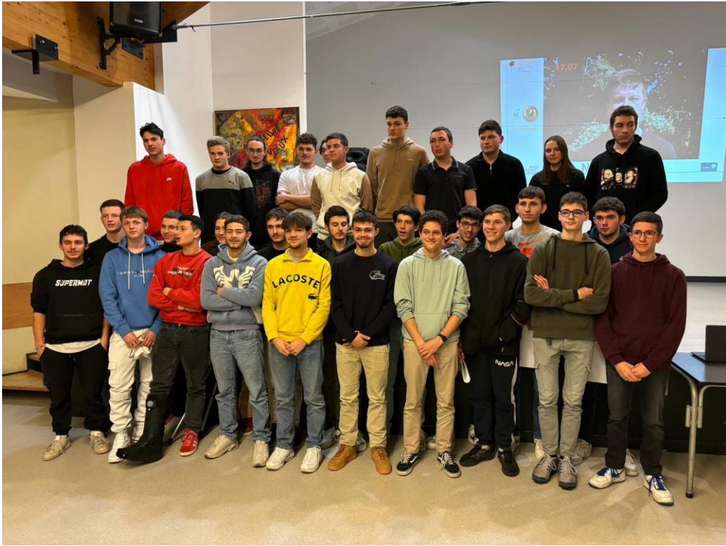
Elèves ayant obtenu leur CAP